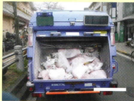
焼損したごみ収集車