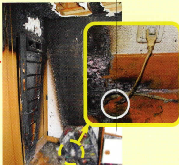
コードから出火した火災

東京消防庁ホームページや東京消防庁公式アプリ内の「 東京消防庁版電気製品火災相談ガイド 」をご覧ください。町田消防署にご相談ください。