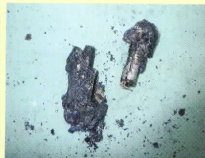
潰れて燃えた充電式電池