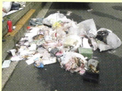
荷箱内の燃えたごみ